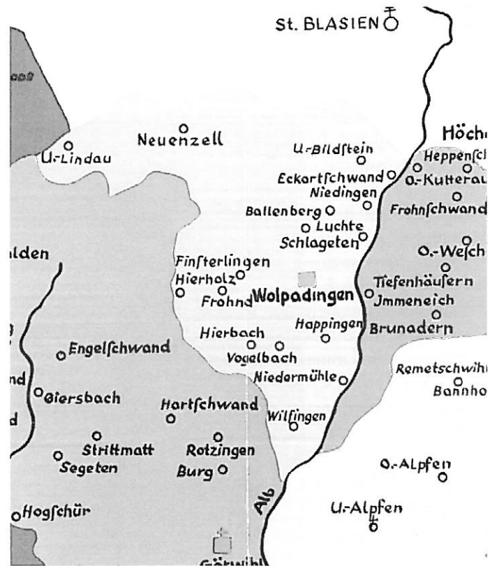
Die Einung Wolpadingen, auch Einung Dachsberg genannt, besaß nie eine eigene Pfarrkirche. Erst nach ihrer Auflösung wurde in Hierbach 1888 eine solche gebaut.

Diese Frage wurde in jüngster Zeit etlichen Personen am Hochrhein und „auf dem Wald“ gestellt, aber kaum jemand wusste eine umfassende Antwort darauf zu geben, sind doch mindestens drei verschiedene Antworten richtig. Denn der Name „Dachsberg“ steht sowohl für eine Gemeinde als auch für eine Landschaft und -man staune- sogar für einen richtigen, wenn auch nur kleinen Berg. Und wer etwas über die Herkunft des Wortes „Dachsberg“ wissen will, hat gar vier Möglichkeiten zur Auswahl.