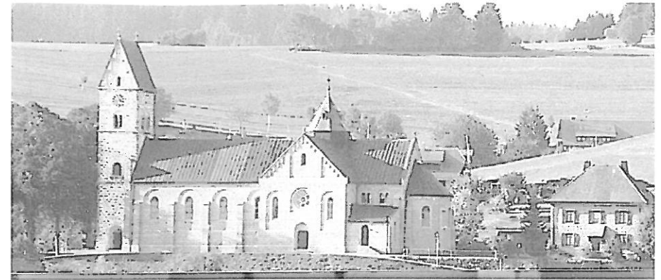
Die Kirche in Hierbach / Dachsberg

Für die meisten Befragten ist er allerdings kein Berg, der Dachsberg, weil sie mit dieser Bezeichnung die politische Gemeinde mit ihren etwas über 1400 Einwohnern meinen, deren 3559 Hektar großes Gebiet sich auf einer Höhenlage zwischen 542 und 1105 Meter über dem Meeresspiegel erstreckt. Das ist die neueste, gerade 33 Jahre alte Auslegung, wie sie vor allem die jüngere Generation kennt, weil sich zum 1. Januar 1971 aufgrund der badenwürttembergischen Gemeindereform die Bewohner von 28 weitverstreuten Wohnsiedlungen aus den ehemals selbständigen Gemeinden Urberg, Wittenschwand, Wilfingen und Wolpadingen zu einer größeren Gemeinde zusammenschlossen, der sie den neutralen Namen Dachsberg gaben.