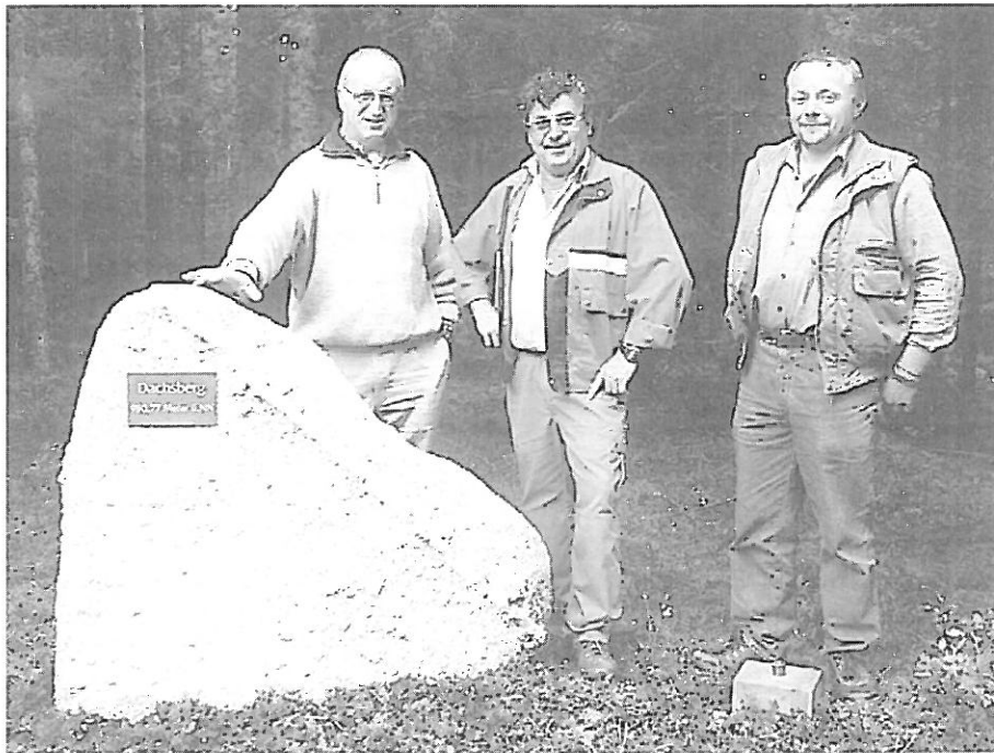
Neben dem beinahe bodenebenen Höhenpunkt „Dachsberg, 950,77 Meter über Normal-Null“ befindet sich seit kurzem ein Gedenkstein und eine Ruhebänk.

markung ebenfalls bis auf den Dachsberg ) und somit für die ganze Stadt St. Blasien eine kleine Enttäuschung: Der höchste Punkt des Dachsbergs , den man mit bloßem Auge kaum abschätzen kann, liegt mit 950,77 Metern tatsächlich auf der Gemarkung Wolpadingen. Und zwar 79 Meter von der Gemarkungsgrenze zu Schlageten entfernt. Die Geschichte braucht nicht umgeschrieben zu werden, und die Gemeinde Dachsberg trägt ihren Namen zu Recht. Allerdings hat ein von der Luchler Seite aus favorisierter Punkt auf Schlageter Gemarkung nur eine um knapp einen Meter geringere Höhe. Einen kleinen Triumph kann die Stadt St. Blasien aber dennoch für sich verbuchen. Eigentümer des Grundstücks, auf dem der höchste Punkt des Dachsbergs liegt, ist einer von ihren Bürgern, nämlich ein Landwirt aus dem Ortsteil Luchle.