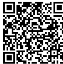
QR-Code Meldeplattform Asiatische Hornisse

Die Asiatische Hornisse breitet sich trotz umfangreichen Bekämpfungsmaßnahmen des Landes weiter in Baden-Württemberg aus. Sichtungen von Einzeltieren und insbesondere Nester sollen weiterhin ausschließlich über die Meldeplattform der Landesanstalt für Umwelt gemeldet werden. Dies kann über die Homepage der Landesanstalt für Umwelt (LUBW) oder über die kostenlose „Meine Umwelt-App“ erfolgen: