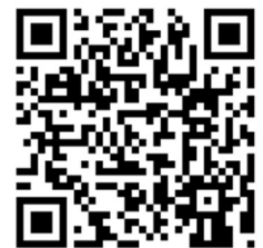
QR-Code Meine Umwelt-App

Die Landesanstalt für Bienenkunde der Universität Hohenheim prüft die eingehenden Meldungen und gibt bei Nestfunden den Meldenden weitere Instruktionen und unterstützt bei der Vermittlung von sachkundigen Personen für die Nestentfernung. Für die Beseitigung von Primärnestern im Frühjahr hat das Ministerium für Ernährung, Ländlichen Raum und Verbraucherschutz (MLR) Finanzmittel zur Verfügung gestellt, welche durch den Landesverband Badischer Imker e.V. verwaltet werden. So können pro Entfernung eines Primärnestes durch eine sachkundige Person 60 Euro auf Nachweis ausgezahlt werden. Nester mit Arbeiterinnen sollten ausschließlich von sachkundigen Personen mit Schutzausrüstung entfernt werden, da eine Stichgefahr droht!